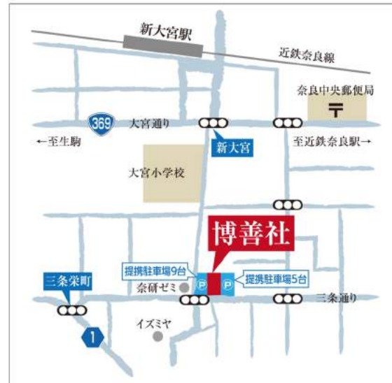
大宮店駐車場20台有(提携駐車場含む)