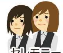
セレモニー アシスタント